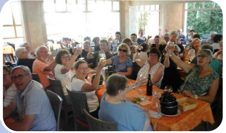
Après l'effort, le réconfort, sortie du 21 juin 2019)

Toutes les séances se dérouleront aux mêmes horaires. Les informations ont été distribuées récemment. Les inscriptions pour la brocante qui se déroulera le 29 septembre 2019 ont été distribuées en même temps. Fort de ses 40 ans d'existence, TSA essaie de répondre au mieux à vos attentes.