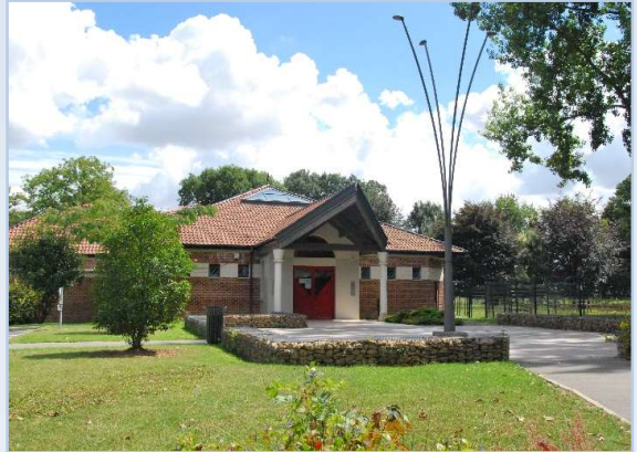
La Salle Polyvalente