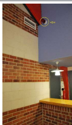
Localisation du girophare.